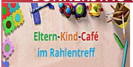
Eltern-Kind-Café im Rahlentreff

Wechselndes süßes Gebäck, Brezeln, Kaffee, Tee, Kakao