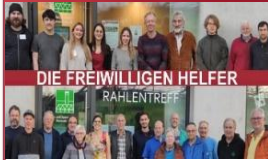
DIE FREIWILLIGEN HELFER

Die freiwilligen Helfer bieten folgende Termine an: