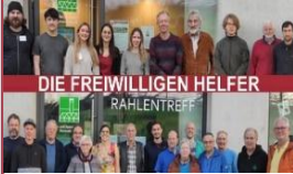
DIE FREIWILLIGEN HELFER

Die freiwilligen Helfer bieten folgende Termine an: